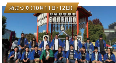
酒まつり(10月11日・12日)

年に2回新入会員セミナーを開催し、商工会議所青年部発足の歴史や青年部規則、また各委員長より委員会の活動内容などを新入会員の方に説明しています。地域を支える青年経済人として何を考えどのように行動して行くべきかを学びます。