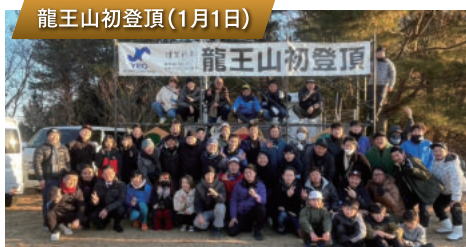
龍王山初登頂(1月1日)

日本を代表する日本酒を主体にしたイベントです。JR西条駅南側の酒蔵通りを中心に2日間開催しており、20数万人の来場者で賑わいます。青年部は酒まつり発足以来、運営に携わっています。