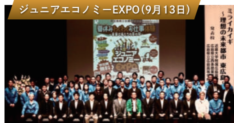
ジュニアエコノミーEXPO(9月13日)

青年部の前身・西条商工会時代から続く、青年部の伝統行事です。昨年度で55回目を迎え青年部会員が、日頃商売をさせていただいていることへの感謝の気持ちを込め、参加される市民の方々におけるこ等の振る舞いを用意し、山頂でお迎えます。